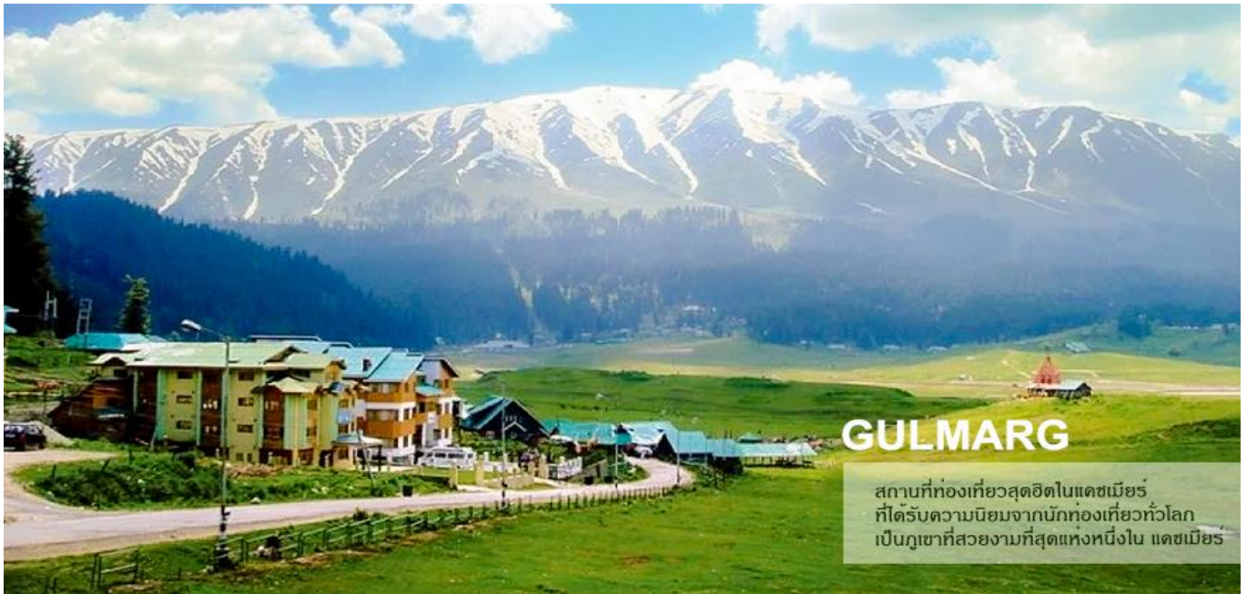
สถานที่ท่องเที่ยวสุดฮิตในแคชเมียร์ ที่ได้รับความนิยมจากนักท่องเที่ยวทั่วโลก เป็นภูเขาที่สวยงามที่สุดแห่งหนึ่งใน แคชเมียร์

บริการอาหารเช้า ณ โรงแรม นำท่านเดินทางไป กุลมาร์ค (Gulmarg) ใช้เวลาเดินทางประมาณ 3-4 ชั่วโมง "กุลมาร์ค" (GULMARG) หรือ "แดนทุ่งหญ้าของดอกไม้ (MEADOW OF GOLD)" "เป็นเทือกเขาอยู่สูงกว่าระดับน้ำทะเล 2,730 เมตร แต่เดิมมีชื่อเรียกว่า เการิมาร์ค ที่นี่ยัง เป็นที่ตั้งของสนามกอล์ฟที่มีหลุมถึง 18 หลุมที่ยังสูงที่สุดในโลก "เทือกกุลมาร์ค" ได้รับการ ยอมรับจากผู้คนมากมายว่าเป็นสถานที่ที่มีทัศนียภาพที่สวยงามแห่งหนึ่งของโลก ที่สวยงาม